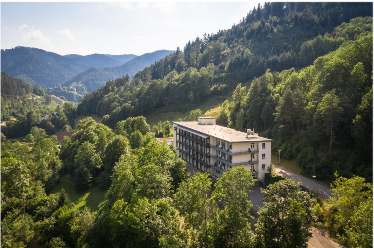
Oberberg Fachklinik Schwarzwald.

Umgeben von Bergen und Bächen, Feldern und Wäldern, liegt die Oberberg Fachklinik Schwarzwald im traumhaft schönen Mittelgebirge. In der privaten Akutklinik für Psychiatrie, Psychosomatik und Psychotherapie steht der Mensch im Mittelpunkt. Fachliche Exzellenz, individuelle Therapiepläne und gelebte Menschlichkeit machen die Klinik zu einem Ort der Heilung. Das allgemeine Behandlungskonzept der Oberberg Kliniken basiert auf einem ganzheitlichen Menschenbild. Bei der Diagnostik werden neben den körperlichen und seelischen Symptomen auch die gesamte Person mit ihrer Biografie, ihrer Persönlichkeit und ihrem sozialen Umfeld betrachtet. Dabei wird stets auf dem neuesten Stand der Wissenschaft gearbeitet und in einer Atmosphäre, in der sich die Patienten wohl- und geborgen fühlen. Um bestmögliche Therapieergebnisse zu erreichen und den höchsten Qualitätsansprüchen gerecht zu werden, erfolgt die Behandlung der Patienten nach einem verbindlichen Prinzip: innovativ, intensiv und individuell.