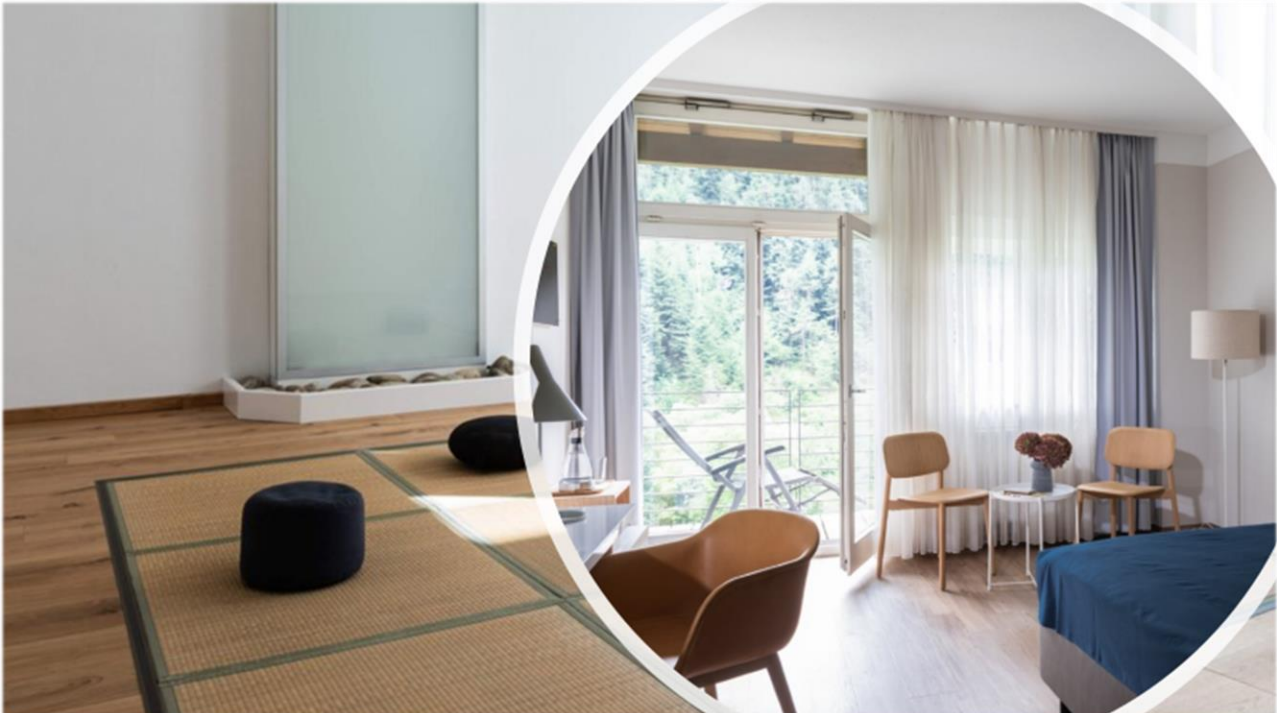
Helle Therapieräume und Patientenzimmer mit Wohlfühlatmosphäre.