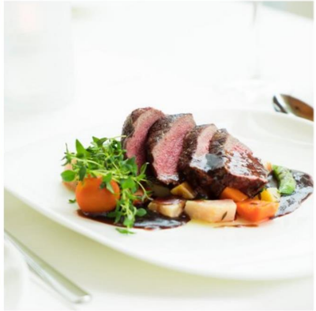
Ausgewogene Ernährung in angenehmer Atmosphäre.