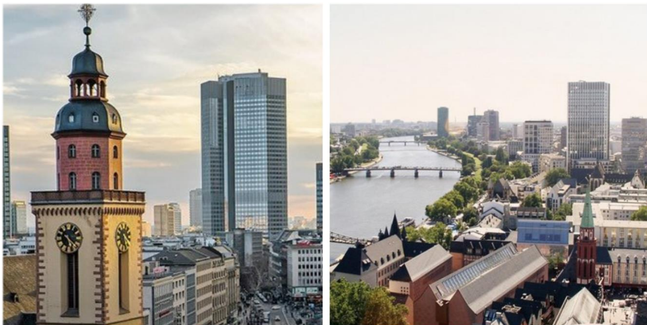
Die Oberberg Tagesklinik Frankfurt am Main im Herzen der Stadt.

Mit dem Auto sind die umliegenden Autobahnen A3, A5, A66 sowie die A661 in wenigen Autominuten zu erreichen.